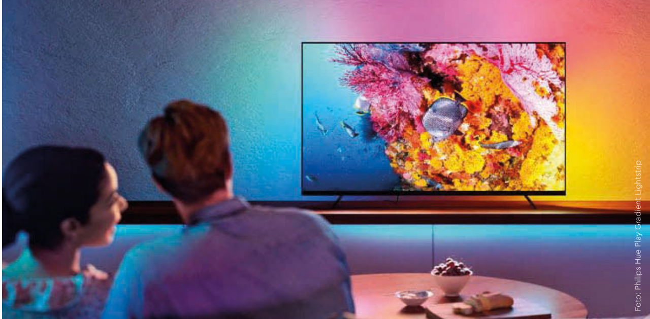
Foto: Philips Hue Play Gradient Lightstrip

Fernsehen ist nicht nur eine Frage der Technik, sondern auch des Geschmacks.