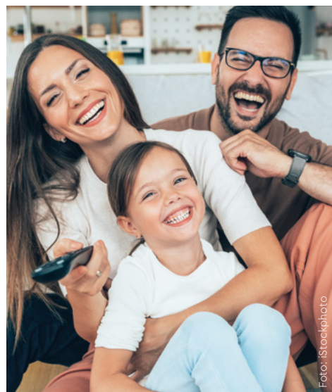
Mit Next TV wird die Familienzeit besser planbar.

Diesem Trend trägt LIWEST Rechnung und hat das Mediatheken-Angebot auf Next TV erweitert. LIWEST Next TV bedeutet „Fernsehen der nächsten Generation – nie wieder die Lieblingssendung verpassen“. Mit Next TV lässt sich das Fernsehprogramm der letzten 7 Tage ganz einfach streamen, mit einem Onlinerecorder aufnehmen und auf verschiedenen Endgeräten ansehen. Hier stehen jetzt insgesamt 27 Mediatheken von 16 öffentlich-rechtlichen und 11 privaten Sendern zur Verfügung. Beim Angebot der Privatsender sind PULS 4, Puls 24, Pro7 maxx, SAT 1 Gold, Sixx, Kabel 1 Doku, ATV und Bild neu dabei,