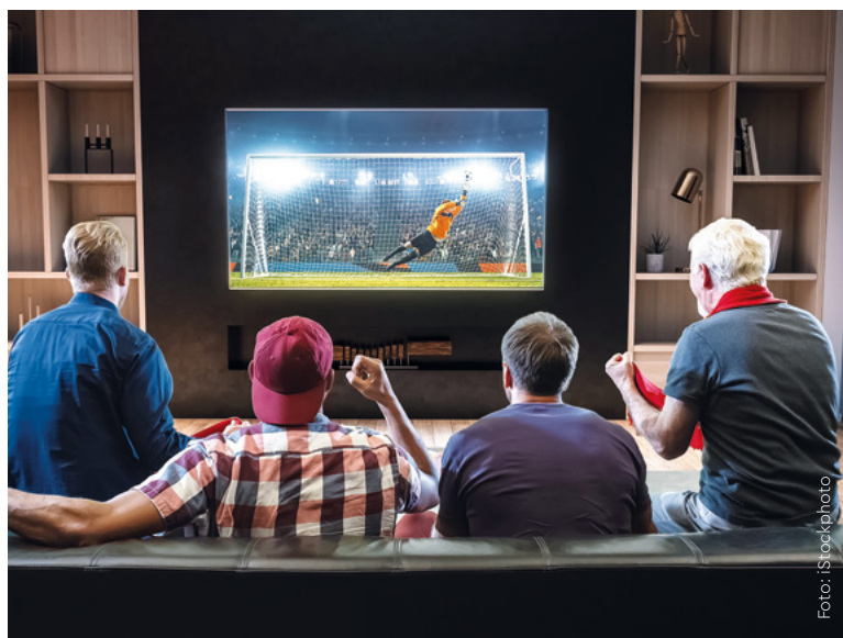
Sportliche Großereignisse, aber auch Filme, Serien und Videospiele leben von einer hohen Bildschirmauflösung, dynamischer Bildqualität und feinem Sound.

Leichte Veränderungen gibt es bei den Bildschirmdiagonalen. Nach wie vor zeigt jedes zweite Neugerät heuer ein Bild mit 50 Zoll oder kleiner (bis 127 cm). Während dieser Anteil gegenüber dem ersten Quartal 2023 aber um drei Prozent zurückging, stiegen die Verkaufszahlen im Bereich 51 bis 65 Zoll (etwa 130 bis 165 cm) und größer auf nunmehr 41 Prozent. 65-Zoll-Fernseher eignen sich bestens für Livesport-, Streaming- und Gaming-Fans. Beeindruckend ist nicht nur die Größe: Solche Geräte ermöglichen ein Heimkinoerlebnis mit brillanten, hochauflösenden Bildern, gut lesbaren Menüs, einfacher Bedienung, vielen Anschlussmöglichkeiten und zahlreichen Apps. Über smarte Funktionen verfügen praktisch alle neu verkauften TV-Geräte (97 Prozent).