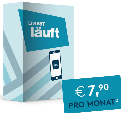
LIWEST läuft App für Internet Solo-Kunden