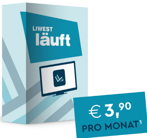
LIWEST läuft App für Internet- und Fernsehkunden

Die LIWEST läuft App ist im App Store und im Google Play Store zum Download erhältlich.